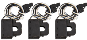
Transformadores de corriente (CT)